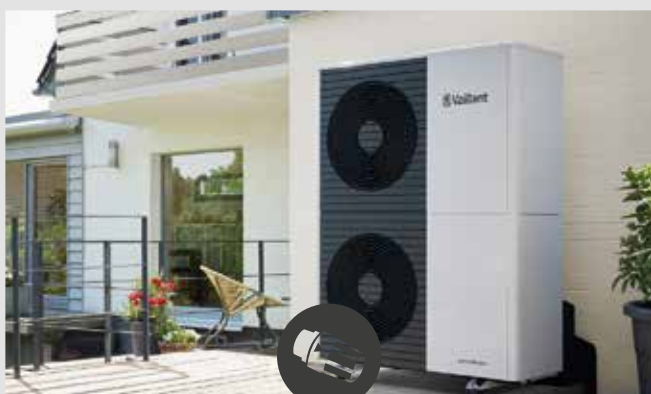
HEIZUNGOPTIMIERUNG UND -TAUSCH